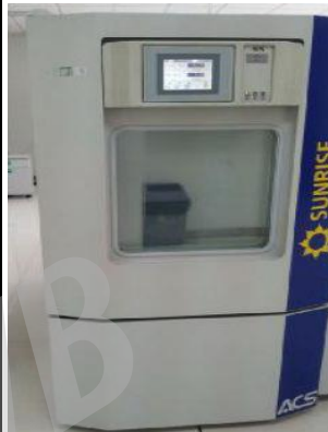
高低温湿热试验箱 Temperature & Humidity Cycling Chamber