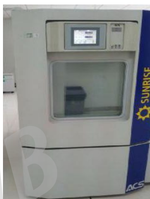
高低温湿热试验箱 Temperature & Humidity Cycling Chamber