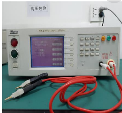
交直流绝缘耐压测试仪 DC/AC insulation and Dielectric Strength tester