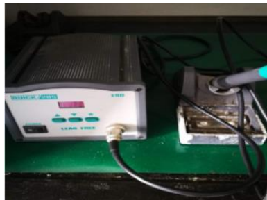
电烙铁 Electric Soldering