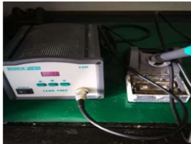
电烙铁 Electric Soldering