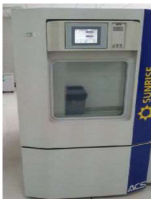
高低温湿热试验箱 Temperature & Humidity Cycling Chamber