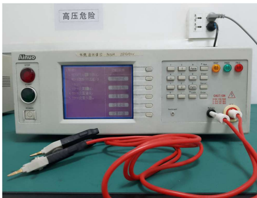
交直流绝缘耐压测试仪 DC/AC insulation and Dielectric Strength tester