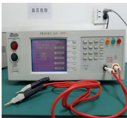
交直流绝缘耐压测试仪 DC/AC insulation and Dielectric Strength tester