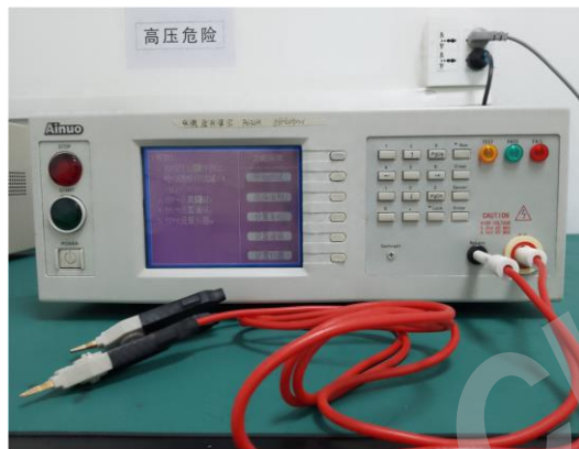
交直流绝缘耐压测试仪 DC/AC insulation and Dielectric Strength tester