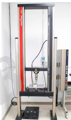
万能拉力试验机 Universal tensile testing machine