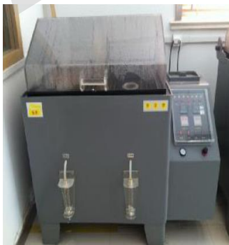
盐雾腐蚀箱 Salt spray Chamber