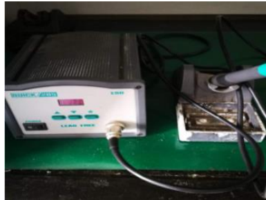
电烙铁 Electric Soldering