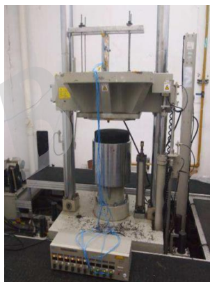
冲击试验台 Shock test system