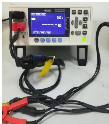
微欧计 Resistance Meter