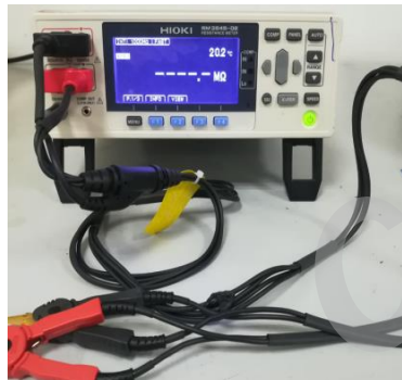
微欧计 Resistance Meter